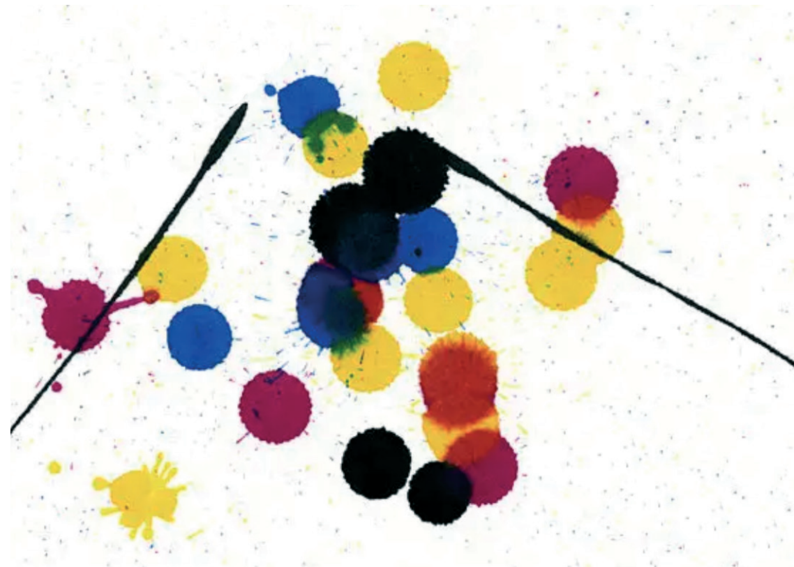
Création et impression FILLION